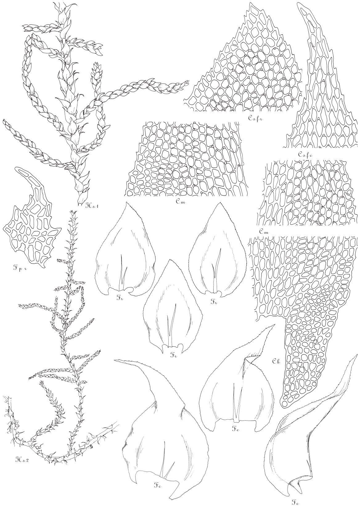
Рис. 134. Heterocladia dimorpha : Hs 2 ×6; Hs 1 ×15; F ×61; Fpr ×317; Cs, m, b ×317.