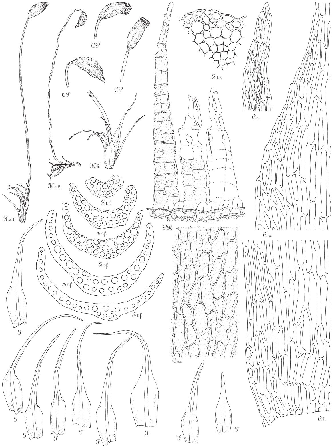
Рис. 141. Pseudoditrichum mirabile : \mathcal{H}c_1, 2 \times 14 ; \mathcal{H}h \times 22.5 ; \mathcal{C}p \times 22.5 ; \mathcal{F} \times 32 ; \mathcal{S}t_f \times 320 ; \mathcal{P}R \times 288 ; \mathcal{C} \text{ ex} \times 288 ; \mathcal{C}_s, m, b \times 320 .